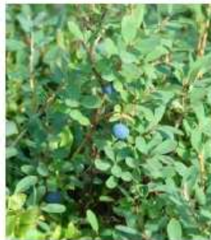
Boven: Rijsbes in 't Venne Links: Vrucht Onder: Bloeiwijze